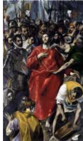
«Ο διαμερισμός των ιματίων του Χριστού ή Espolio»

Τον 20ό αιώνα, το έργο του Greco επανεξετάστηκε αποκτώντας τελικά την εξέχουσα θέση που διατηρεί ως σήμερα στην ιστορία της τέχνης. Υπήρξε αδιαμφισβήτητος ένας από τους μεγαλύτερους ζωγράφους της εποχής του. Επηρέασε πολλούς ζωγράφους αλλά και κινήματα του 20ου αιώνα, ενώ με την προσωπικότητα και το έργο του ασχολήθηκαν πολλές φυσιογνωμίες από το χώρο της λογοτεχνίας και της ιστορίας της τέχνης.